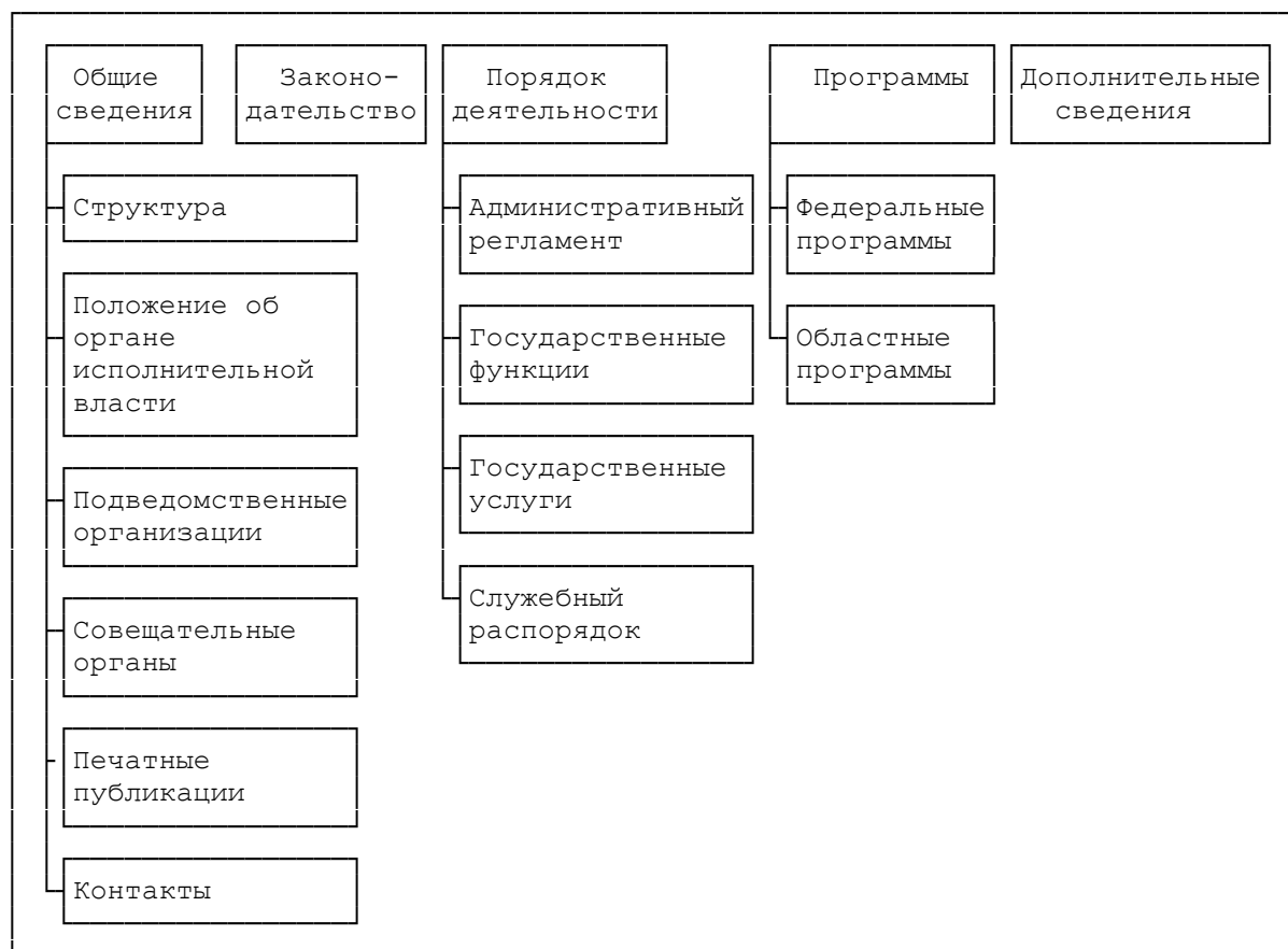
Схема навигационной панели интернет-сайта органа исполнительной власти