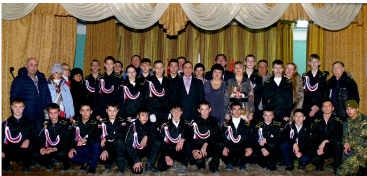
Курсанты набора 2016 года

Чаще всего нежелание оставаться в школьном коллективе связано с проблемой потери здорового микроклимата для некоторых повзрослевших, но по сути еще мальчишек и девчонок. Проблема есть, но далеко не всегда находят те взрослые, что готовы помочь в ее разрешении.