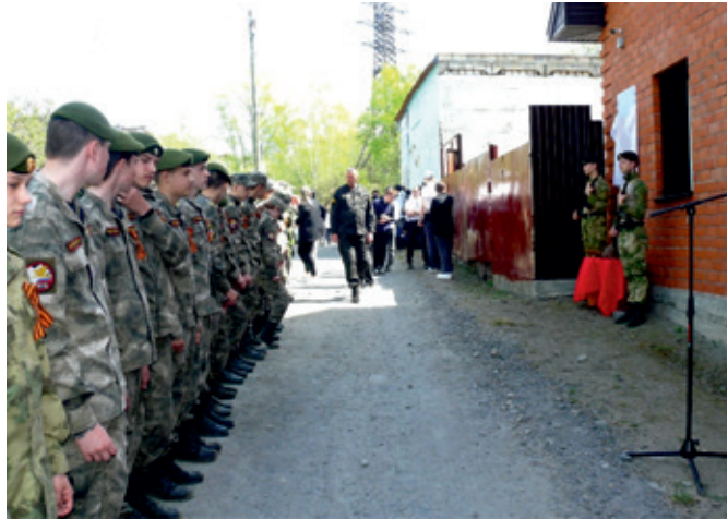
Открытие мемориальной доски, посвященная генералу-армии, Герою Советского Союза Ватутину Н.Ф.

В осенние, зимние и летние каникулы ребята проходят учебно-полевые сборы в спортивном оздоровительном лагере «Бригантина» на озере Увильды, а также на базе отдыха «Метеор» на озере Тургояк. Вся эта работа направлена на то, чтобы воспитать в ребятах дух патриотизма, сориентировать их на путь профессионального становления в той или иной области, дать им путёвку