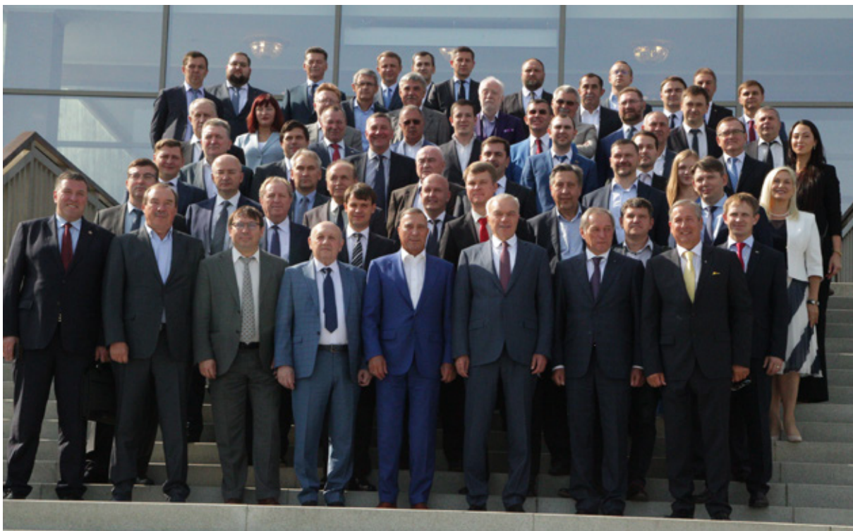
Это сегодняшний надёжный актив Союза промышленников и предпринимателей Челябинской области

Мы выработали строжайшие правила для всех членов Союза, которые обязательны по настоящее время: