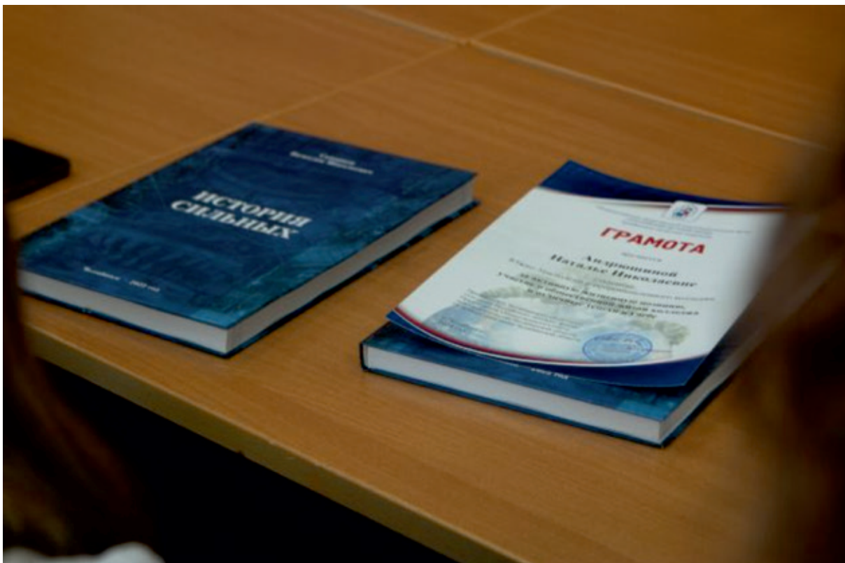
Книга Скворцова каждому лучшему студенту ЮУ Агропром колледжа

Лучшие из лучших рассказывают о своих успехах в учебе, научной работе, творчестве и волонтерстве.