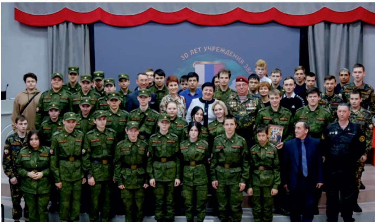
Группа курсантов 8 класс и 9 класс (2021 год)

альностей, в лицензии их 47, выбирается профессия или специальность, основы которой ребята будут изучать.