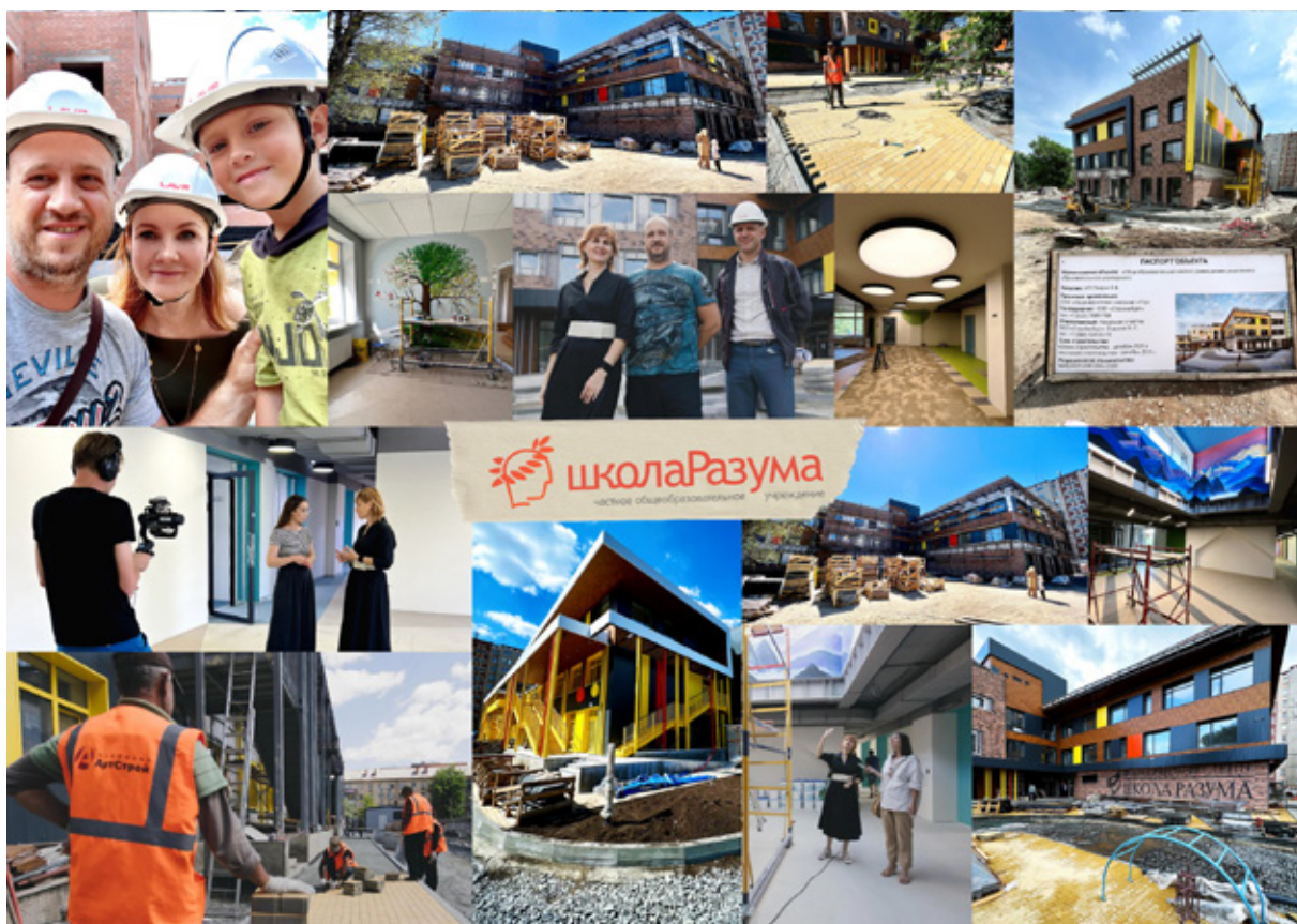
Процесс строительства «Школы Разума»

по итогам 2022-2023 учебного года высоки: 100% абсолютная успеваемость, 100% качественная успеваемость.