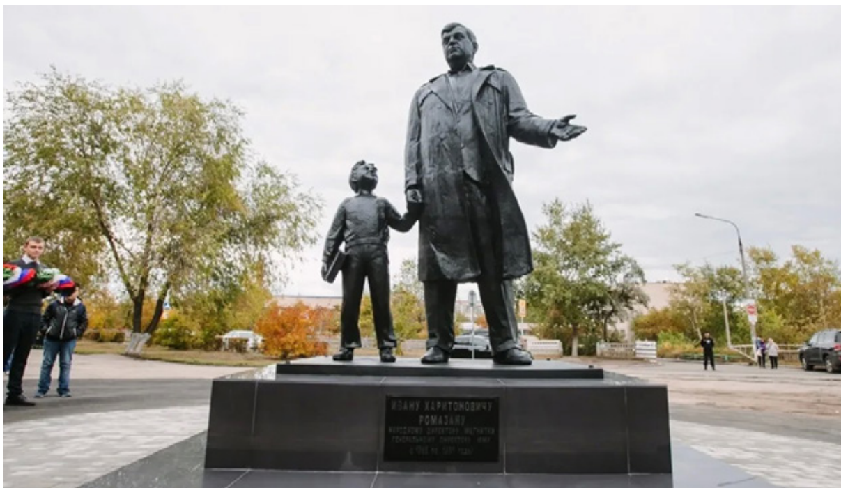
Памятник И.Х Ромазану в Магнитогорске

Магнитогорск - город относительно молодой, его строили как город-сад, с широкими проспектами, уютными дворами. Проект города был подготовлен институтом архитектуры Ленинграда и немецкими специалистами, старавшимися сделать максимально удобный и просторный город без хаотичной застройки.