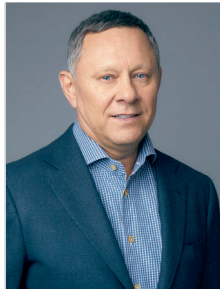
Коростелев Сергей Павлович. Президент Группы Магnezит. Член СПП

Всё указанное решается постоянным развитием системы образования, что создает новые возможности развития Саткинского района.