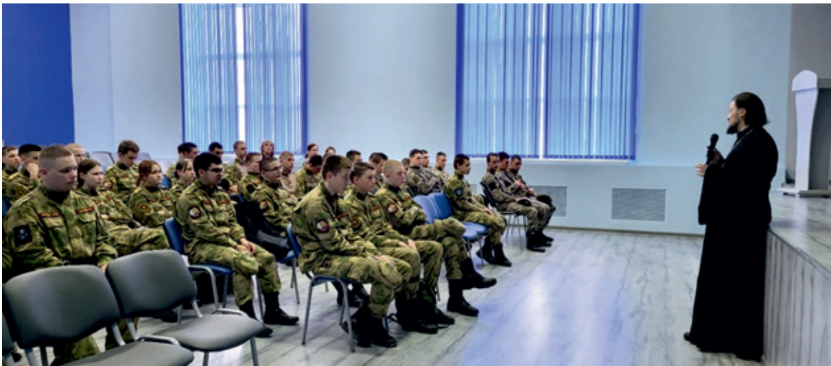
Представители Епархии проводят лекции и беседы для курсантов

дением профессиональной образовательной организацией «Златоустовский техникум технологий и экономики» и Религиозной Организацией «Златоустовская Епархия Русской Православной Церкви (Московский Патриархат)».