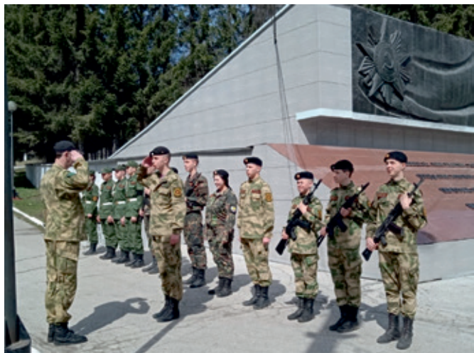
Вахта памяти у Мемориала Славы